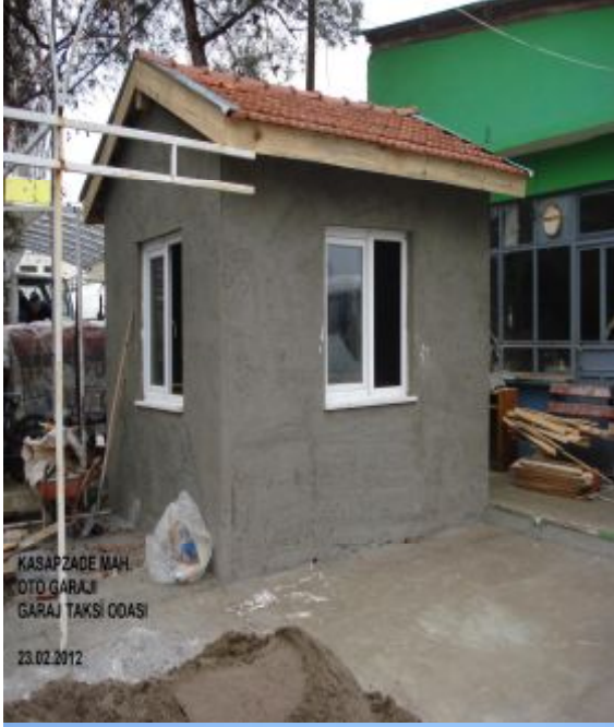
KASAPZADE MAH. OTO GARAJI GARAJ TAKSI ODASI 23.02.2012