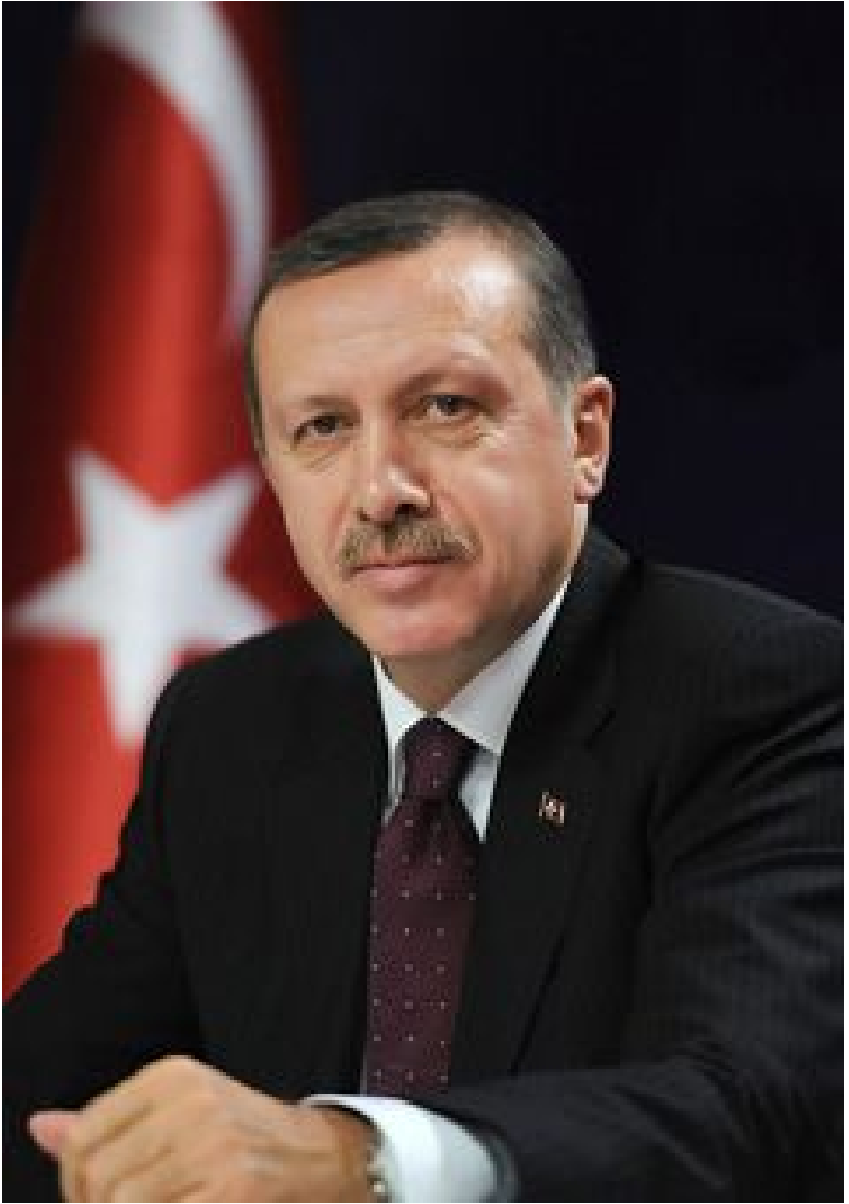
RECEP TAYYİP ERDOĞAN BAŞBAKAN