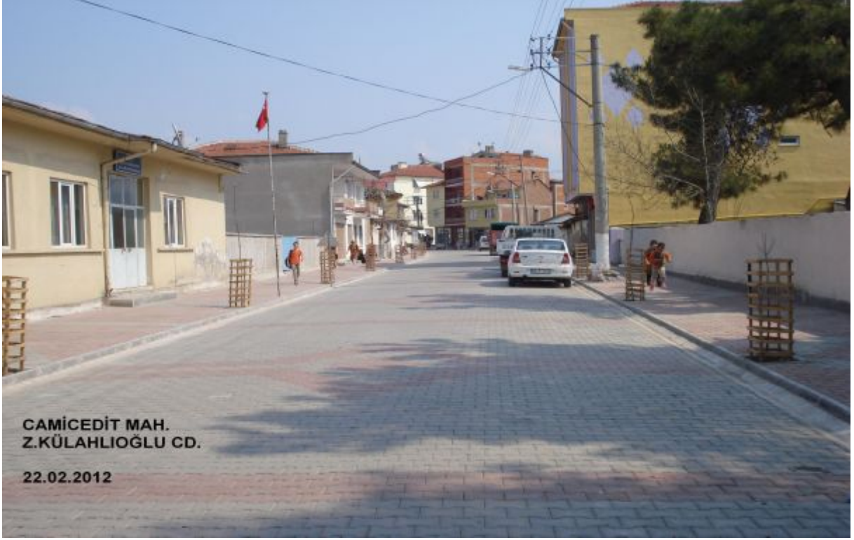
CAMİCEDİT MAH. Z.KÜLAHLIOĞLU CD.