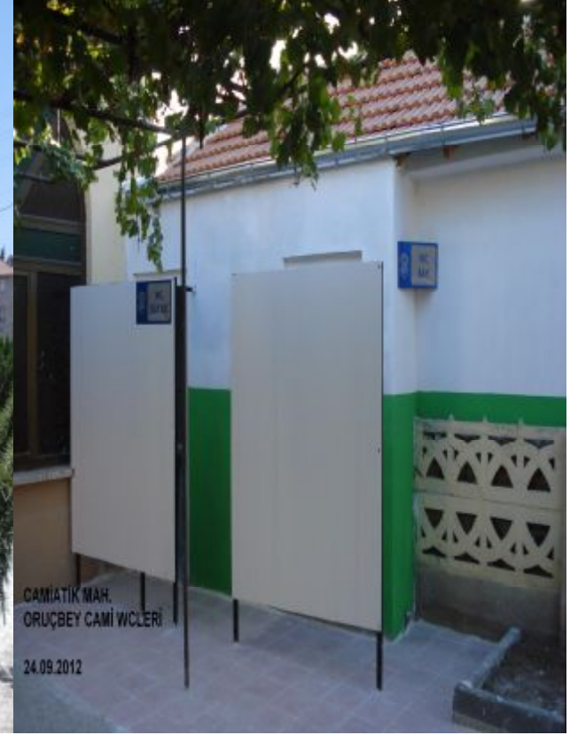
CAMİATİK MAH. ORUÇBEY CAMİ WC 24.09.2012