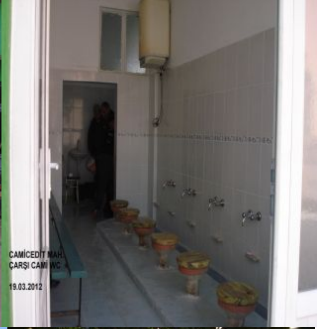
CAMİCEDİT MAH. ÇARŞI CAMİ WC 19.03.2012