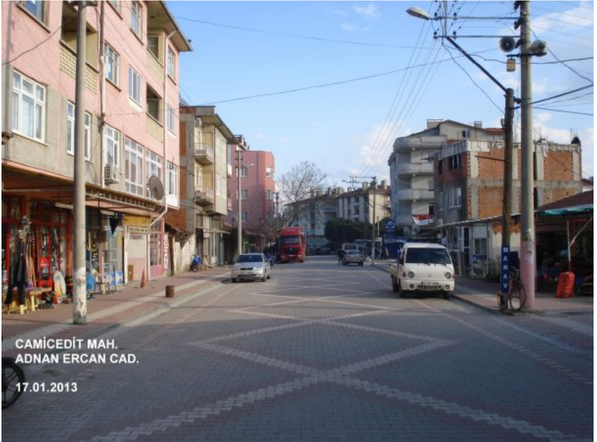
CAMİCEDİT MAH. ADNAN ERCAN CAD.