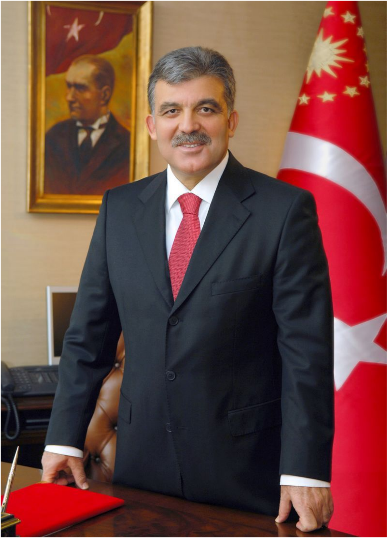
ABDULLAH GÜL CUMHURBAŞKANI