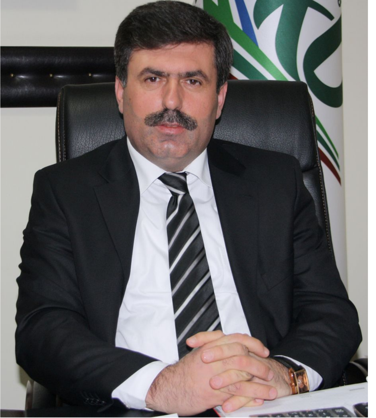
İSMAİL CANKUL KEPSUT BELEDİYE BAŞKANI