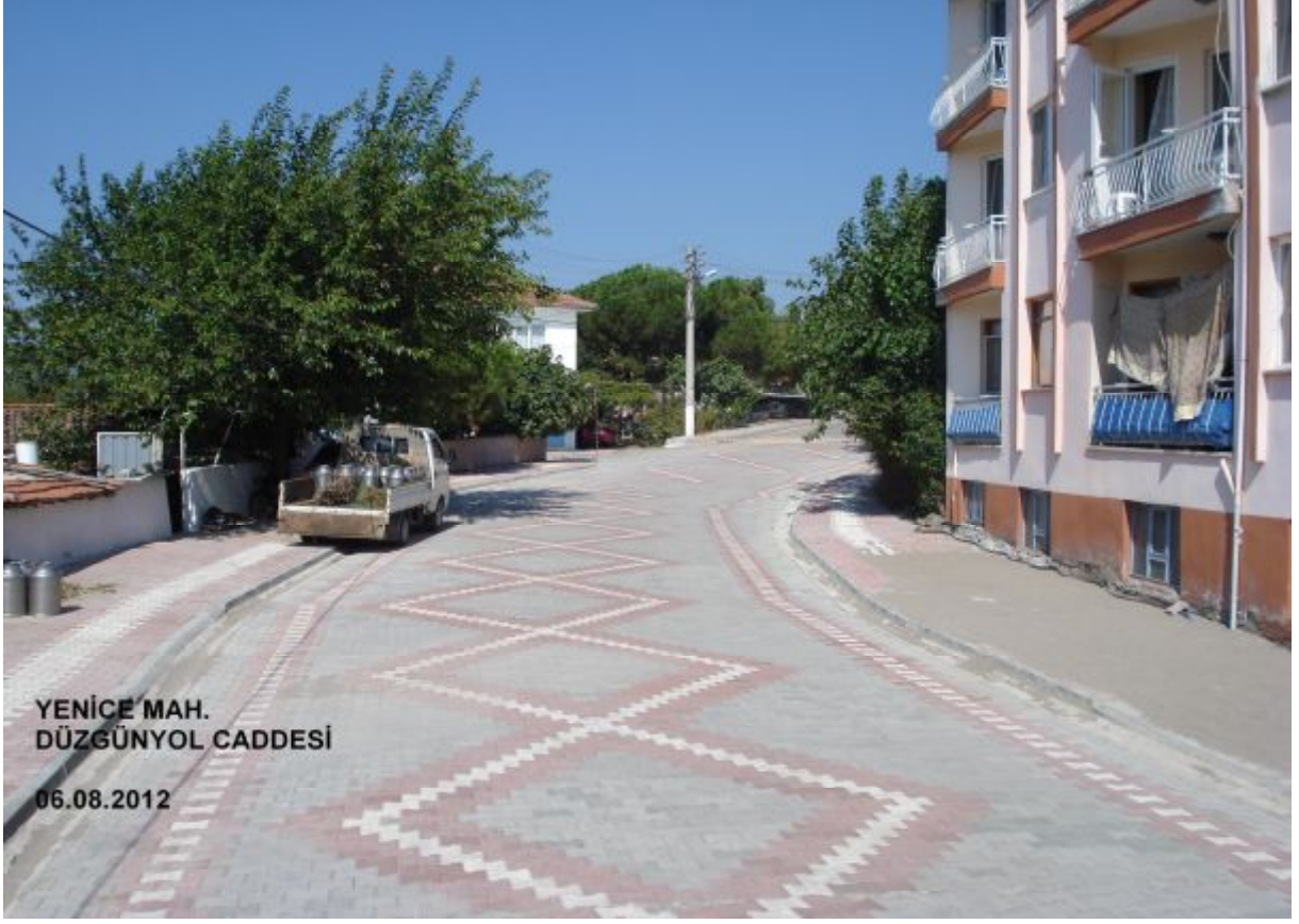
YENİCE MAH. DÜZGÜNYOL CADDESİ