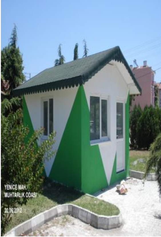
YENİCE MAH. MUHTARLIK ODASI 20.09.2012