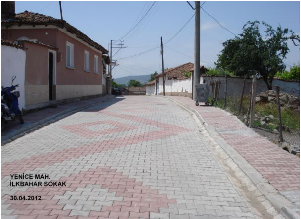
YENİCE MAH. İLKBAHAR SOKAK